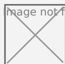
TABELA - WYSOKOŚĆ SKŁADKI 2024

Uchwała nr 52/2023 Zarząd Okręgu PZW w Katowicach w sprawie uchwalenia składek członkowskich na ochronę i zagospodarowanie wód dla członków PZW oraz opłat za zezwolenie na amatorski połow ryb dla wędkarzy niezrzeszonych na rok 2024 r . pdf